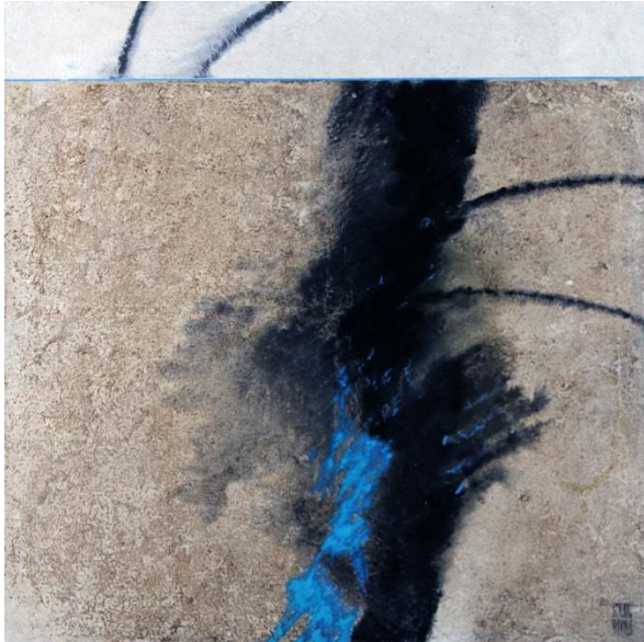
Crépusculaire – huile sur toile – 65 x 81 cm