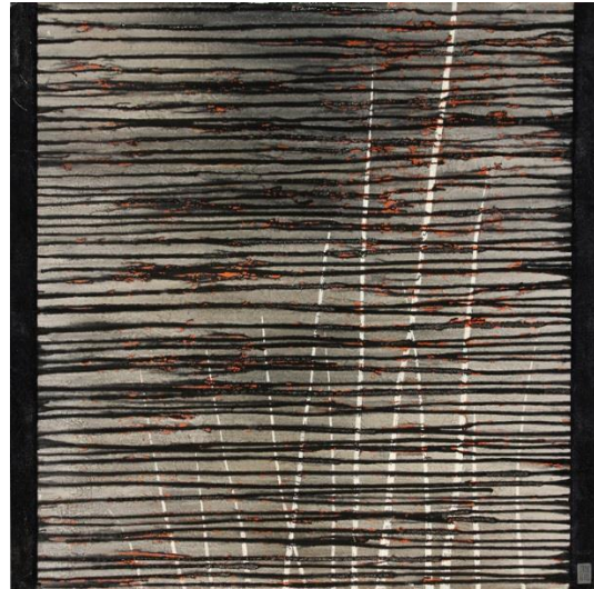
L'étang dépassé – huile sur toile – 100 x 100 cm

FORMATION – Ma vie active commence par le dessin industriel, puis je deviens modèle et photographe publicitaire.